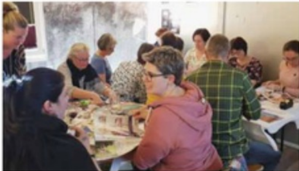
Die Teilnehmenden konnten sich gleich selbst kreativ betätigen.

Am ersten Abend der Reihe «Mini Büaz – Dini Büaz. Do schaff i!» stellte sich Ladina Gisep Bachmann vor.